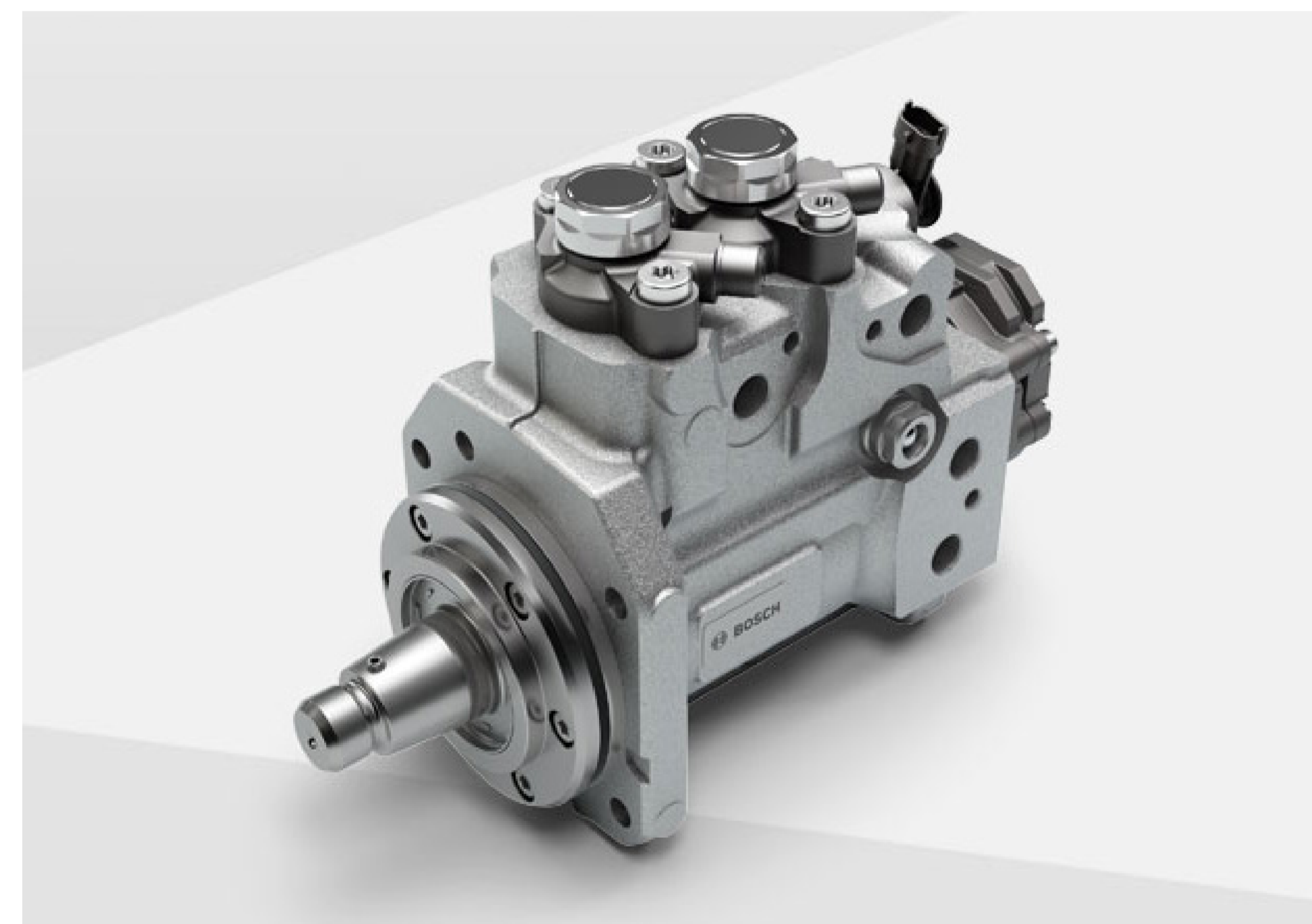
Hochdruckpumpe CPN6-25/2 GP mit Kraftstoff-Vorförderpumpe

Maßgeschneiderte Varianten für vielfältige Applikationen